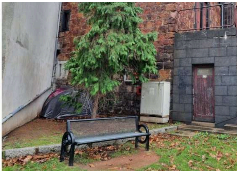
Une tente, dans un coin, loin des regards. Voilà le seul abri pour plusieurs familles dans le Roannais.

Le collectif roannais "Pas d'enfant à la Rue" a envoyé un courrier au Président du Conseil départemental pour demander à le rencontrer.