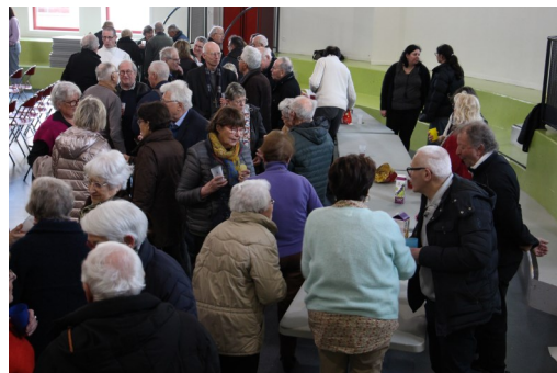
Apéritif et échanges entre paroissiens