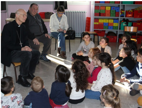
Ecole St Isidore au Grand Quartier