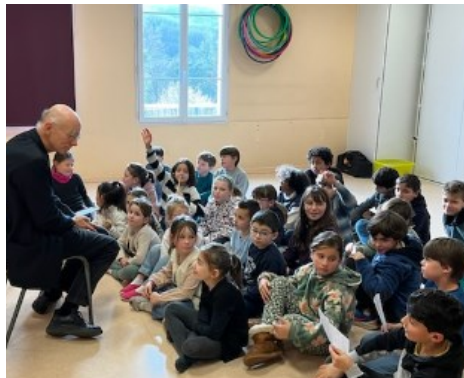
Ecole ND de Bel Air à La Fouillouse