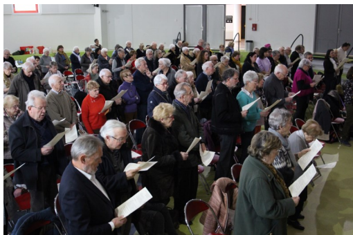
L'assemblée dominicale à L'Espace G Rouchon

L'assemblée a alors rejoint les tables dressées par les équipes relais pour un apéritif très convivial, suivi d'un repas partagé.