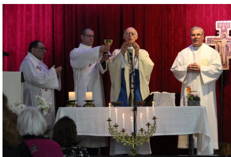
Les célébrants autour de notre évêque