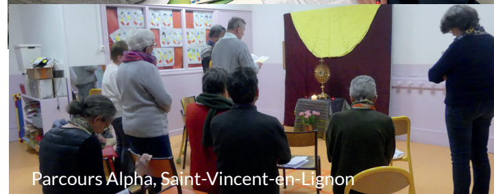
Parcours Alpha, Saint-Vincent-en-Lignon