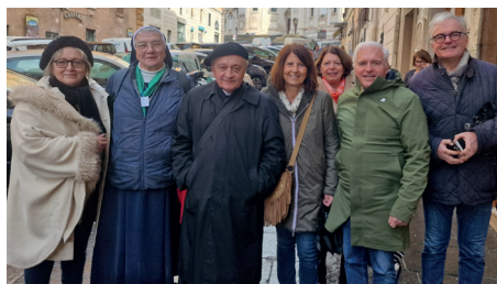
Une fraternité à Rome

Commençons donc par le commencement ! Commençons par vivre la fraternité à taille humaine, simplement, dans la gratuité de la relation, ce qui va permettre d'accompagner les personnes qui veulent découvrir la foi et de renouveler celles qui sont engagées depuis longtemps dans la vie de l'Église, pour que, tous ensemble, nous soyons disciples-missionnaires. Les premières communautés chrétiennes (Ac 2, 42-47) nous donnent l'exemple d'un partage profond de la foi et de la vie quotidienne. Se rassembler en petites fraternités, chaleureuses, permet de créer des liens authentiques, de partager ses joies et ses peines, ses découvertes et ses questions, en se laissant éclairer par la Parole de Dieu, par l'expérience des autres, en se soutenant mutuellement, pour avancer ensemble à la suite du Christ. Le cadre « familial » favorise l'écoute, la confiance. Il offre aussi un espace d'accueil pour ceux qui sont