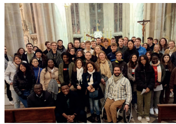
18 novembre : étapes vers le baptême pour des lycéens, étudiants et jeunes pros.