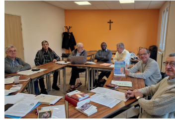
20 novembre : rencontre des prêtres et diacre pradosiens.