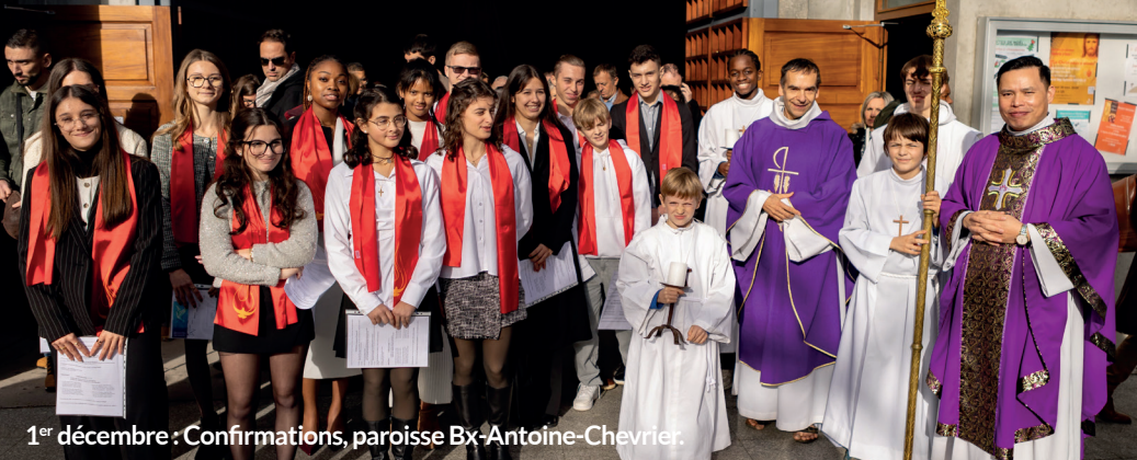
1 er décembre : Confirmations, paroisse Bx-Antoine-Chevrier.