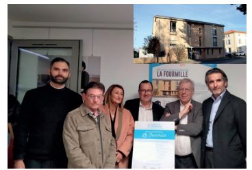
1 er décembre : inauguration de la maison intergénérationnelle "La Fourmille" à Montbrison.