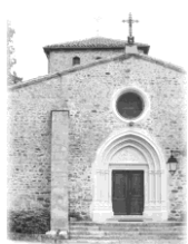
Sts Pierre et Paul