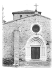
Sts Pierre et Paul