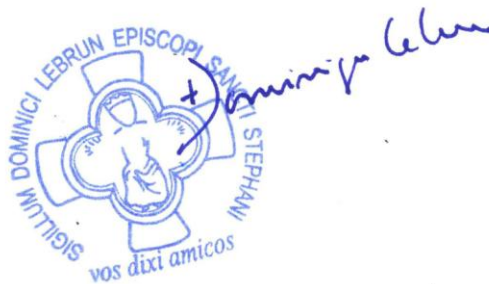
✠ DOMINIQUE LEBRUN Evêque de Saint-Etienne